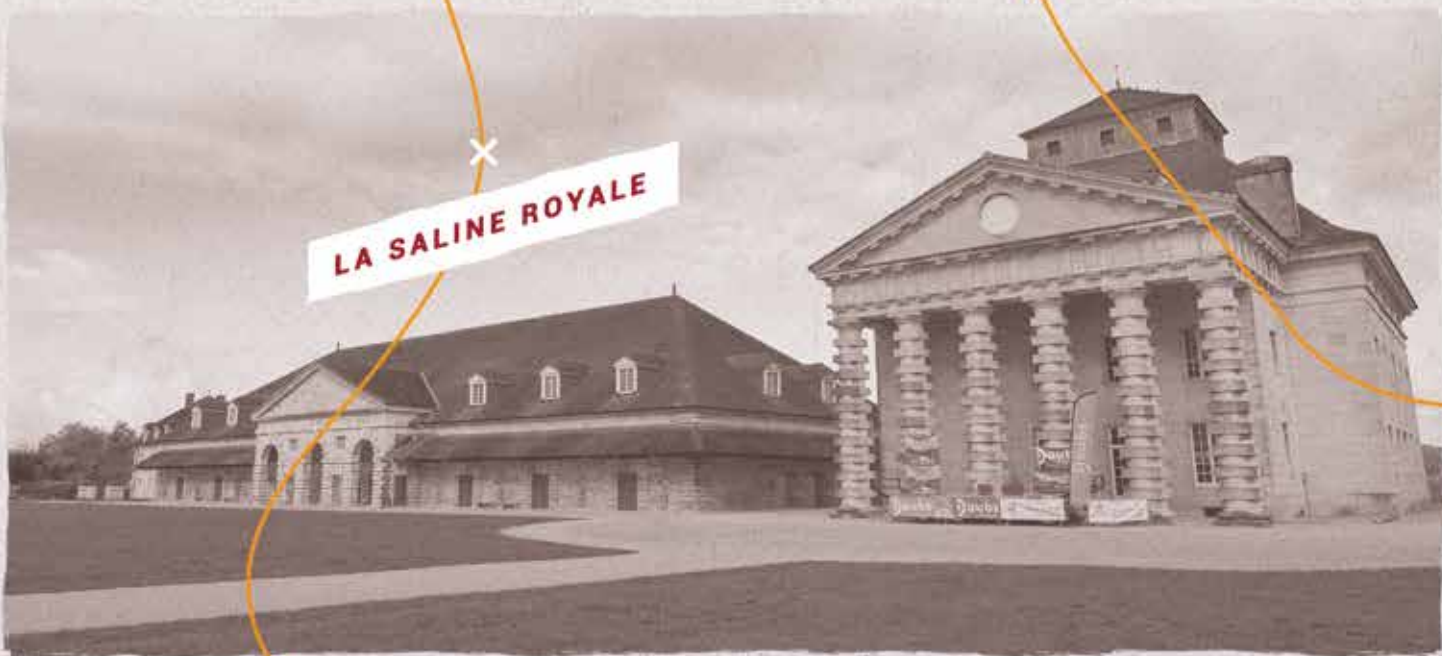
LA SALINE ROYALE